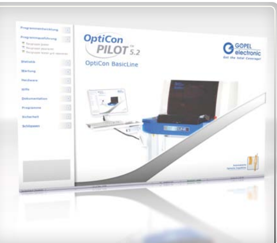
Softwareoberfläche OptiCon PILOT