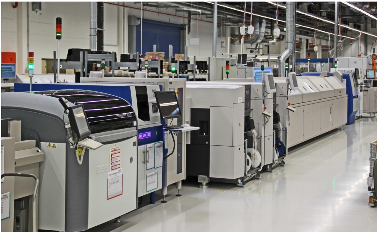
Abb.2: Neue Fertigungslinie am Erfurter Standort

Eine bestehende Linie wurde vom vorherigen Standort Mühlhausen übernommen und dient heute auch der Herstellung bereits länger etablierter Produkte. Die neuesten Baugruppen werden auf einer erst 2013 installierten modernen zweiten Linie gefertigt. Stetig wachsende Nachfrage insbesondere auch aus dem Ausland sorgt für pausenlosen Betrieb beider Produktionslinien. In Zahlen ausgedrückt: pro Schicht werden aktuell ca. 12.000 Baugruppen gefertigt und inspiziert, die Jahressumme beträgt etwa 4.350.000. Knapp 85 Prozent fallen dabei allein auf den Heizkostenverteiler des Typs Q caloric, dem beliebtesten Produkt im Portfolio. Geringe Taktzeiten und großer Durchsatz verlangen dabei nach Inspektionsmethoden, die nicht zum Flaschenhals werden. QUNDIS setzt dafür auf optische Inspektionsgeräte von GÖPEL electronic.