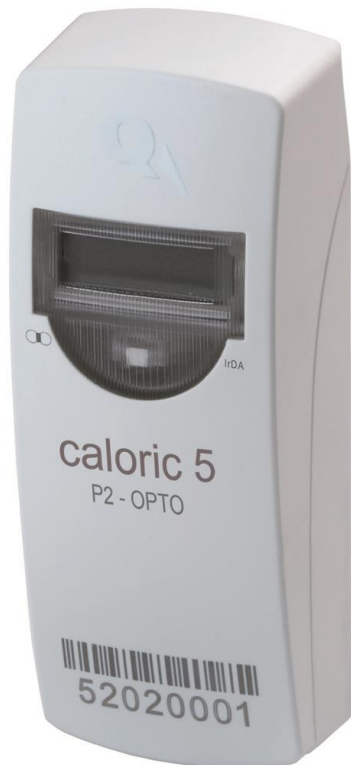
Abb.1: Qcaloric - elektronischer Heizkostenverteiler

In QUNDIS' Produktpalette befinden sich hauptsächlich verschiedene Typen von Heizkostenverteilern, die sich im Aufbau gering in ihren Spezifikationen voneinander unterscheiden. In der Produktionslinie werden sechs verschiedene Baugruppen gefertigt, welche vom Design ähnlich sind und in 20er-Nutzen bestückt werden. Geräte der Standard-Klasse dienen dem manuellen Ablesen des Verbrauches. Der Trend geht jedoch in Richtung „walk-by“-Geräte mit Funkübertragung, wodurch der Ableser „von außen“ ohne Beisein des Mieters die Daten erfassen kann. Neueste Entwicklungen ermöglichen sogar die Datenübertragung via Internet. Alle Modelle sowie Hardware zur Kommunikation zwischen den Geräten (bspw. Sende- und Empfangsstationen) werden in der Erfurter Produktionsanlage auf zwei Linien gefertigt.