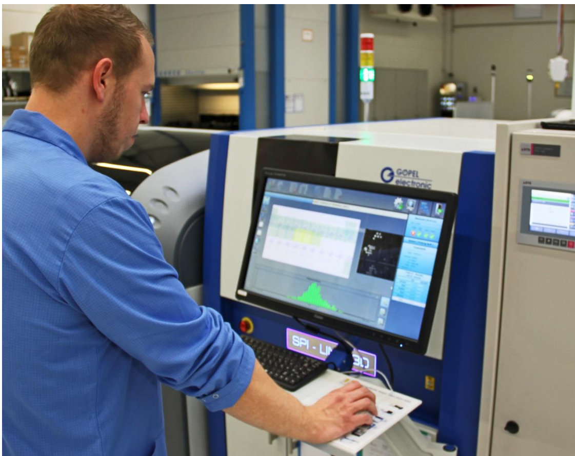
Abb. 3: Darstellung der Prozesslage am SPI-Line 3D

kaum möglich. Deshalb entschieden wir uns dazu, die Inspektion vorzulagern und dadurch Rückschlüsse auf fehlerhafte Lötstellen zu ziehen.“ Gegenüber 2D-SPI-Systemen oder der druckerintegrierten Inspektion ist vor allem die dreidimensionale Prüfung von Bedeutung: „Wir erkennen nicht nur ob ein Pad mit Lotpaste benetzt wurde oder nicht, sondern erfassen beispielsweise das genaue Volumen, den Druckversatz, die Höhe und Brückenbildungen, welche später Kurzschlüsse verursachen können.“ Das SPI-Line 3D erkennt dabei nicht nur Einzelfehler. Die gesamte Prozesslage wird in übersichtlichen Grafiken dargestellt. Verschieben sich Prozessparameter, so kann schnell reagiert werden, um Folgefehler zu vermeiden. Die Bedienbarkeit des Systems stellte sich als besonders vorteilhafter Aspekt heraus: „Uns hat die intuitive Benutzeroberfläche der Software überzeugt. Im Gegensatz zu anderen Anbietern erfolgt die Prüfprogrammerstellung logisch und schnell.“ Auch im folgenden Produktionsablauf bietet das SPI-Line 3D ein besonderes Plus: sind die fertig gedruckten und inspizierten Nutzen in der angeschlossenen Pufferstation gelagert, kann der Bediener über die Software zwischen SPI und Puffer kommunizieren und detektierte Fehler klassifizieren. Die als „Gut“ sortierten Baugruppen münden anschließend im Rehm-Reflow-Ofen, welcher in dieser Länge einzigartig in den neuen Bundesländern ist.