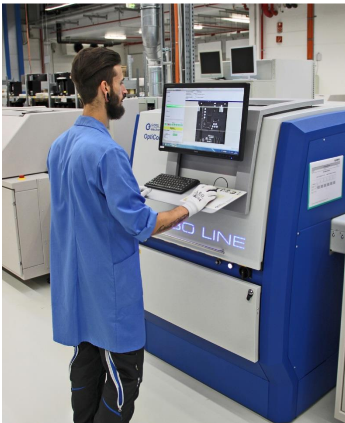
Abb.4: Optische Inspektion mit dem TurboLine

Der hohe Qualitätsanspruch bei QUNDIS erfordert natürlich zu vorheriger Lotpasteninspektion auch eine Post-Reflow-Inspektion. Dabei konnte ebenfalls ein System von GÖPEL electronic das Benchmarking für sich entscheiden. Die doppelseitige High-End-Inspektion des TurboLine war klarer Sieger in Sachen Prüfgeschwindigkeit und –Genauigkeit. „Die Schnelligkeit der optischen Inspektion ist auch in unserer Produktionslinie von besonders großer Bedeutung. Das TurboLine-AOI kann Schritt halten mit dem hohen Durchsatz unserer Fertigung.“ Dafür sorgt die doppelseitige Inspektion sowohl der Ober-, als auch Unterseite der Baugruppen. Das Wenden bestückter Nutzen ist nicht nötig, zusätzliche Handlingmodule können eingespart werden. Durch eine Inspektionsgeschwindigkeit von bis zu 60cm 2 /s werden die Taktzeiten immens reduziert.